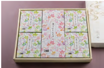
④ ざるそば 4人前 + にしんそば 1人前 3,600円 (税込)