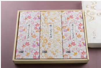
⑤ かけそば 1人前 + にしんそば 2人前 3,170円 (税込)