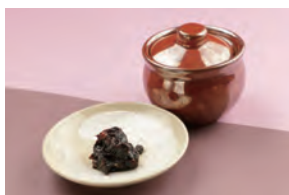
T⑤ そばみそ (60g)