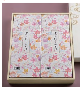
⑨ にしんそば 2人前