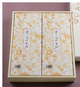
⑪ かけそば 2人前