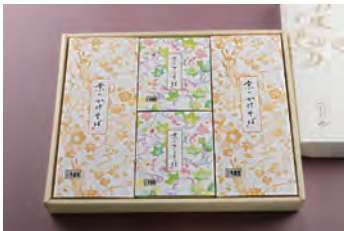
③ ざるそば 2人前 + かけそば 2人前 2,900円 (税込)