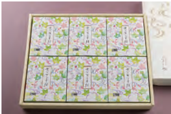
② ざるそば 6人前 3,600円 (税込)