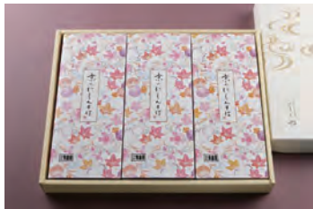
① にしんそば 3人前 3,500円 (税込)