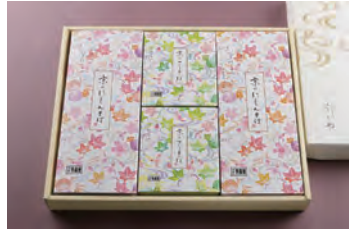
⑦ ざるそば 2人前 + にしんそば 2人前 3,600円 (税込)