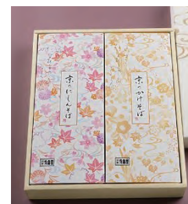
⑬ かけそば 1人前 + にしんそば 1人前