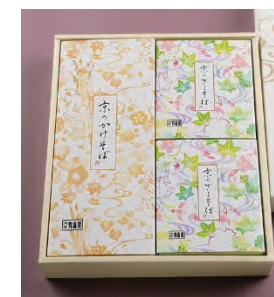
⑭ ざるそば 2人前 + かけそば 1人前