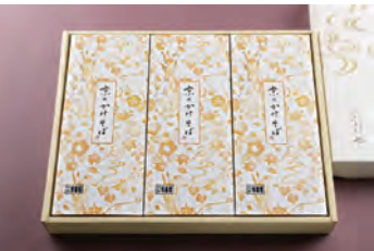
⑥ かけそば 3人前 2,490円 (税込)