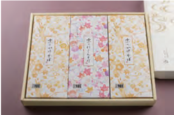
⑧ かけそば 2人前 + にしんそば 1人前 2,830円 (税込)