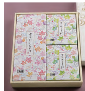
⑫ ざるそば 2人前 + にしんそば 1人前