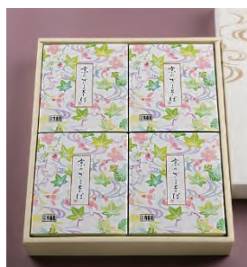
⑩ ざるそば 4人前